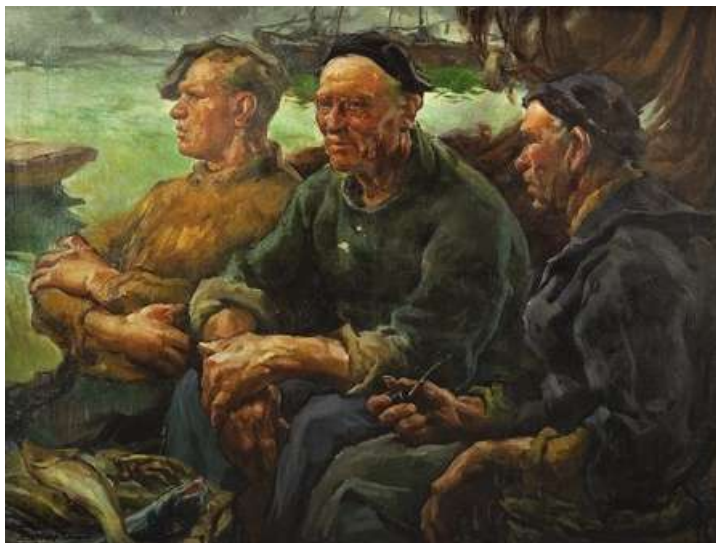
"Pescadores en descanso"