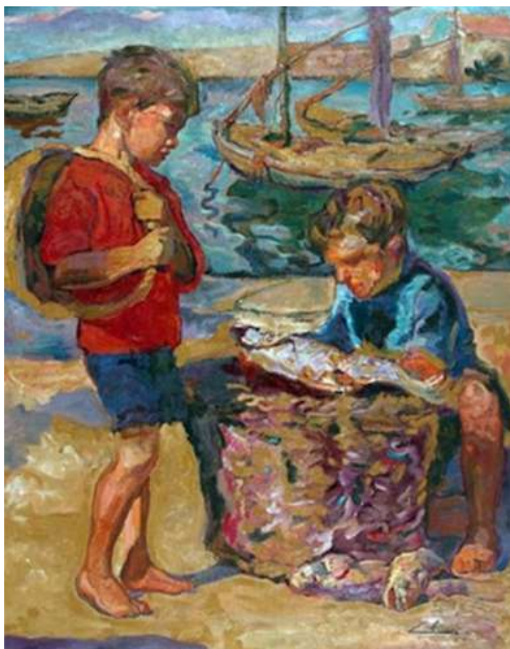
"Niños en el espinel"

Falleció en la Ciudad de La Plata el 20 de noviembre de 1974 a los 75 años.